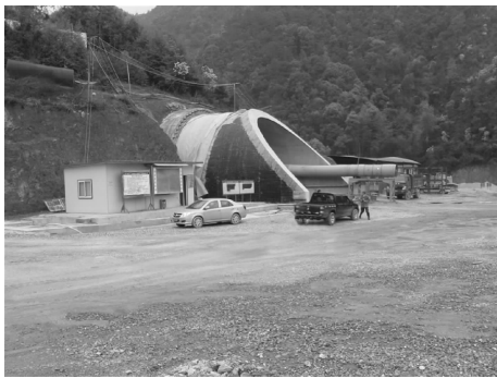
图1 道吾山隧道洞口施工现场

泥质(D2t)砂岩,石英砂岩;隧洞体岩层多变,岩性复杂,但都遭受过弱变质作用,岩石工程性能相应增强,岩石总体为较软-较硬岩,进出口端为软-极软岩,岩体破碎-较破碎,进出口端为极破碎。隧道中轴线与岩层走向以小锐角相交,与岩层面以大锐角相切,较好地利用和保持了岩体自承载能力,因此场地岩层,岩性适宜建造隧道构筑物。