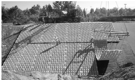
图2 铰链式混凝土砌块生态护坡图

(5)铰链式砌块固定:将绳索拉紧锚固在顶部混凝土格埂里,以防铺面系统沿着坡道或纵向滑动,同时也防止个别块体从系统中丢失,增加铺面系统的整体性。