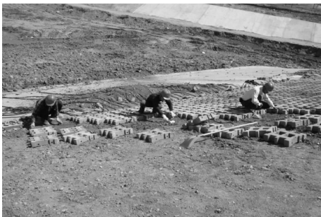
图 3 铰链式混凝土砌块生态护坡施工现场 (2009 年 11 月江苏连云港大圣湖)