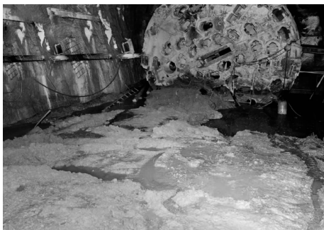
图2 TBM遭遇泥石流、涌沙