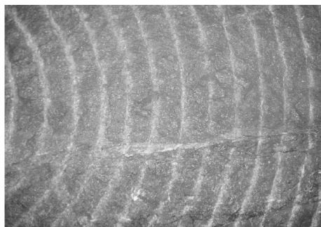
(b) 下元古界片麻岩、花岗片麻岩